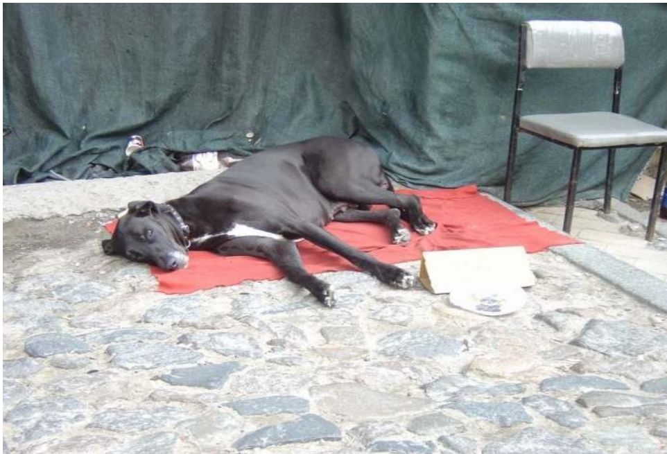
Kievo - urbo kun multe da kontrastoj - petanta hundo