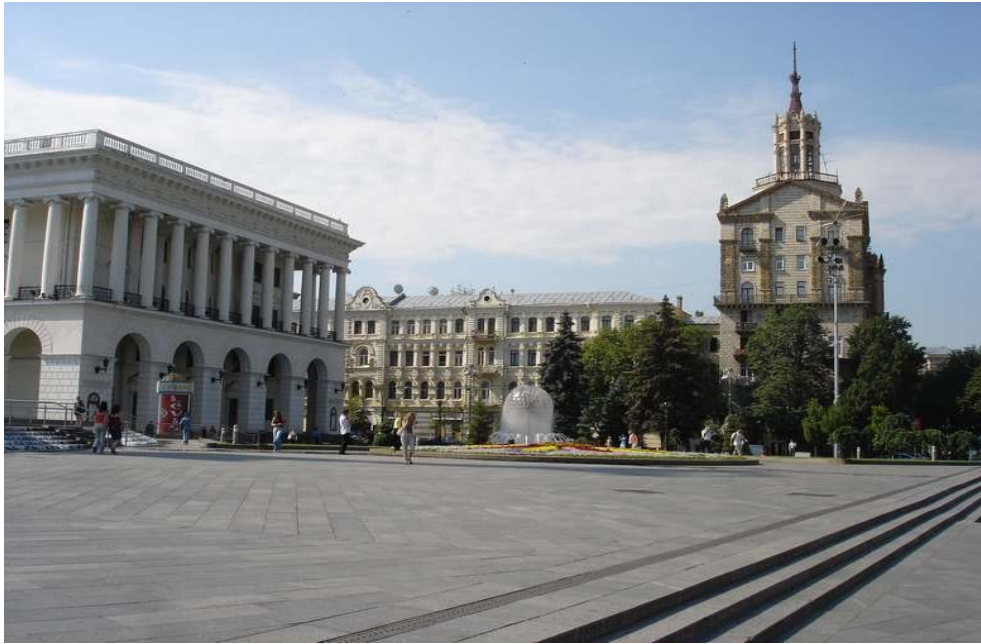
La placo de sendependeco (Majdan Nezaležnosti)