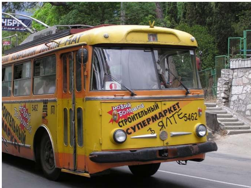
Loka trolebuso