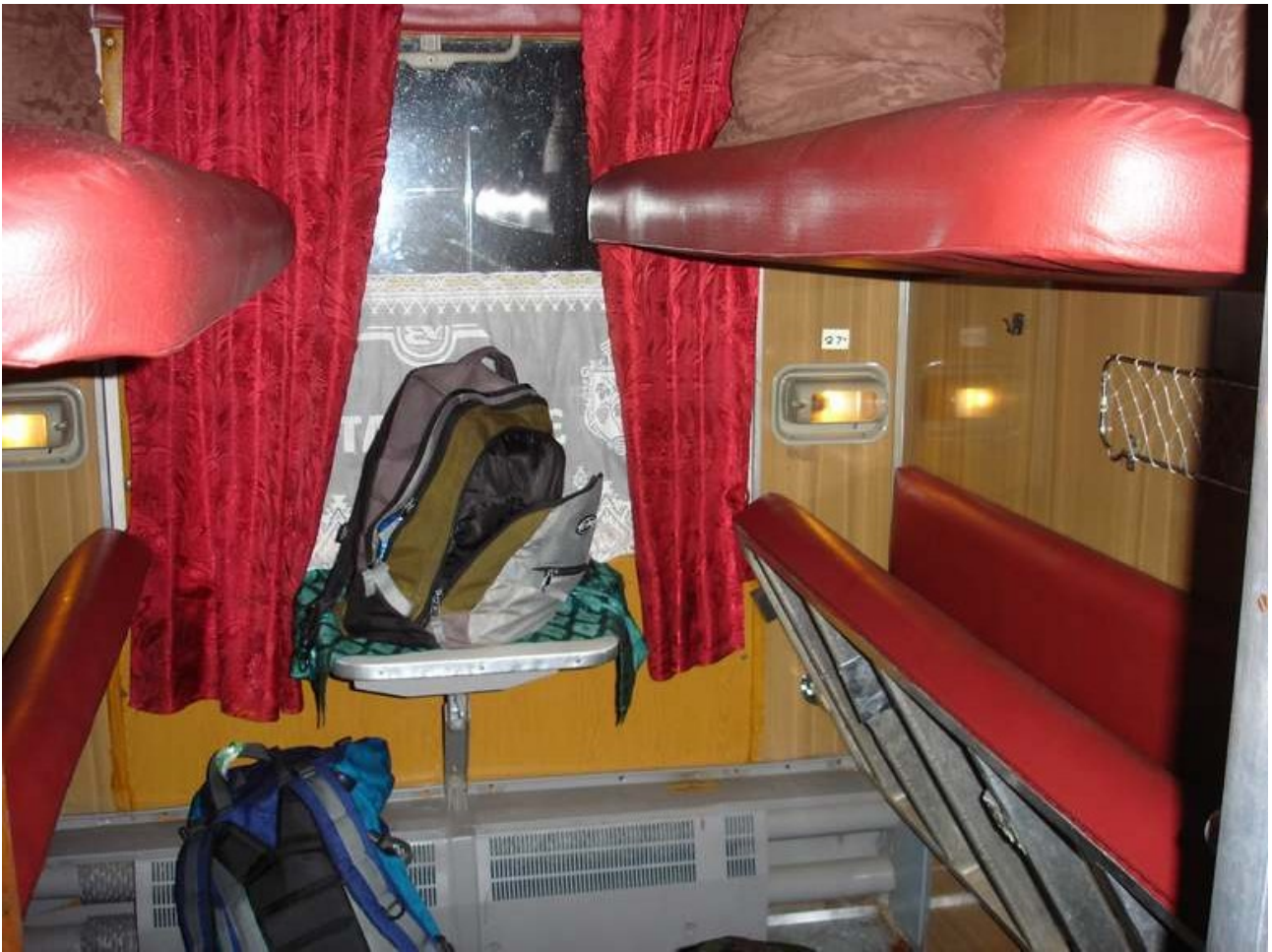
Kupeo kun litoj