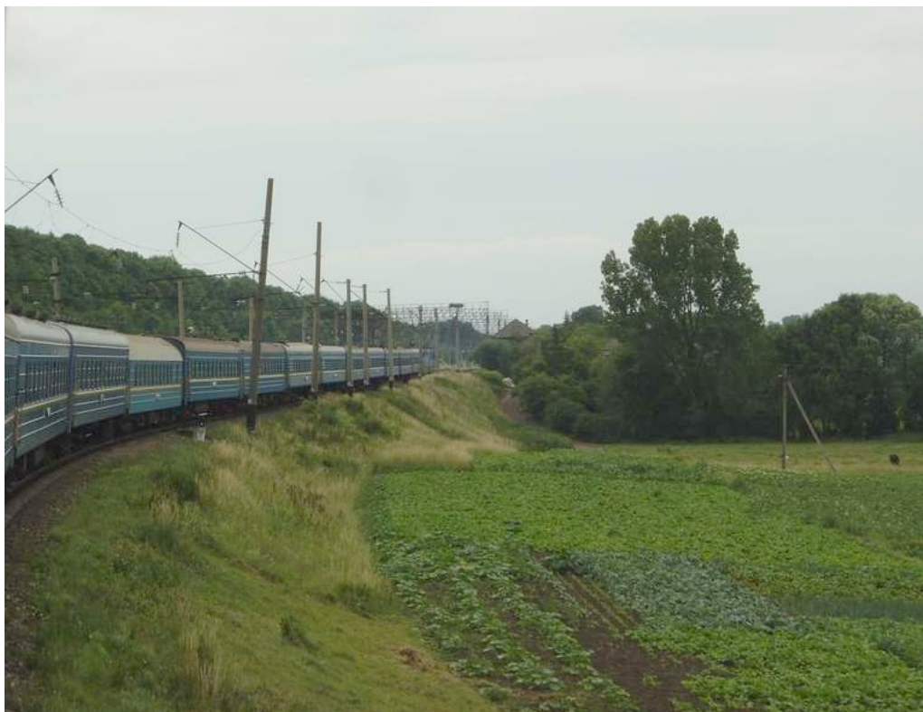
Nia trajno estis longa...

Post longa ŝovado de la trajnoj (5 horoj) ni finfine je 13:52 ekveturis plu, direkto Simferopolo. Restas 25 horoj de la originaj 38. Ĉirkaŭ la sepa kaj duono mi kun Juraj kaj Andrej surbaze de rekomendo de Marek iris en la manĝovagonon, kie ni havis bieron. Ni ankaŭ rigardetis en vagonon – lokkartan. Vespere dum iom da tempo ludis vortpiedpilkon. Post la dekonua ni enlitiĝis. Mi dormis pli bone ol dum la antaŭa nokto.