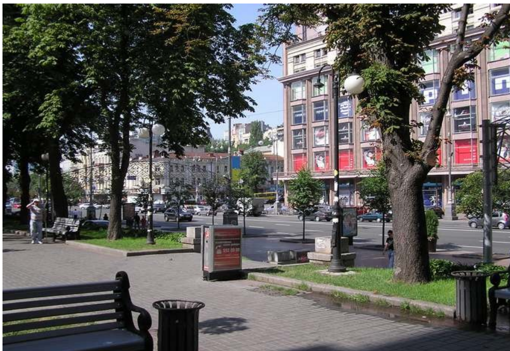
Avenuo en Kievo