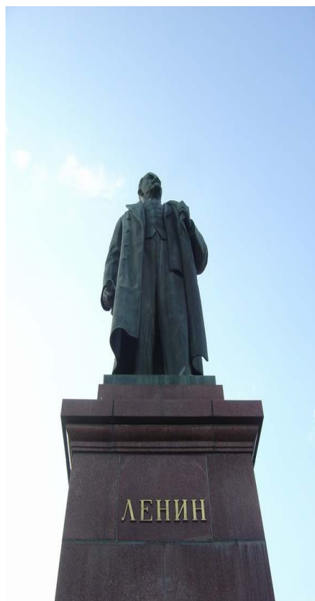
La statuo de Lenin