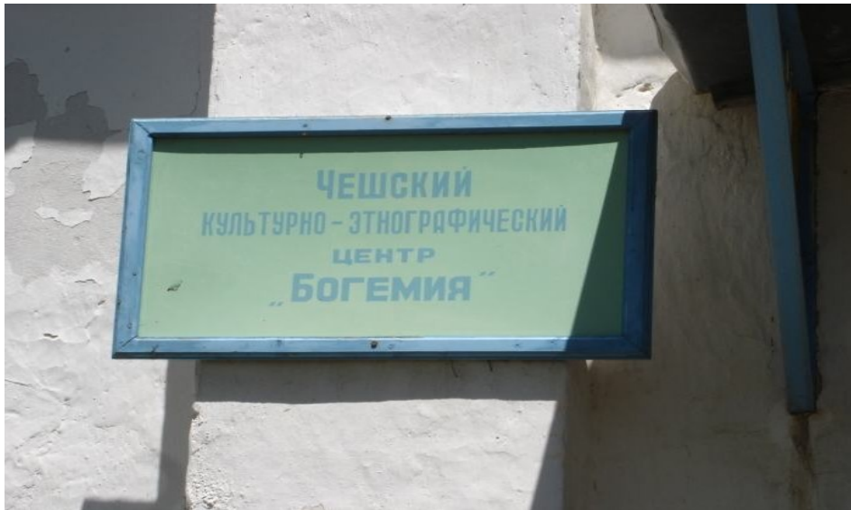
Čeň - kultura etnografia centro "Bohemija"