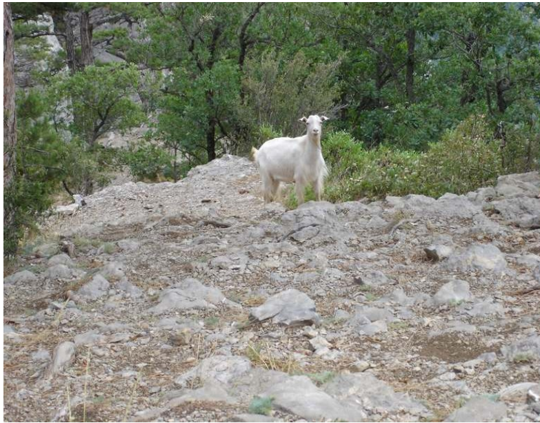
Kaproj en montaro