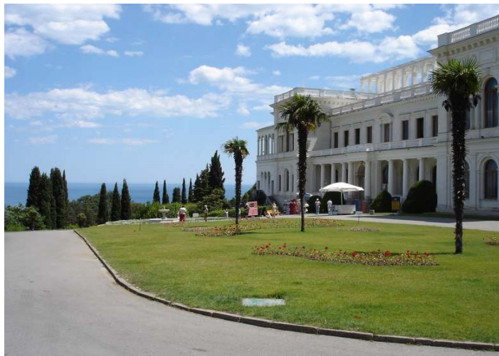
Levadia palaco

Matene ni atendis la alvenon de Saŝa. Poste atendis nin mallonga transloĝiĝado. Poste jam nenio plu malhelpis nian starton al la Levadia palaco, nome la palaco de la jalta konferenco. Kaj poste ankaŭ al la plaĝo. La maro mojosas:-) Poste ni iris al Jefim kaj al „market“, nome bazaro. Denove uzinte trolebusojn ni iris al tranoktejo.