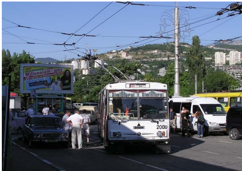
Jes, tio estas trolebusoj faritaj de Škoda:-)