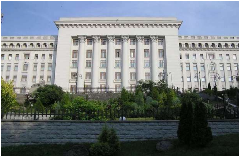
Rezidejo de la prezidento en strato Bankova