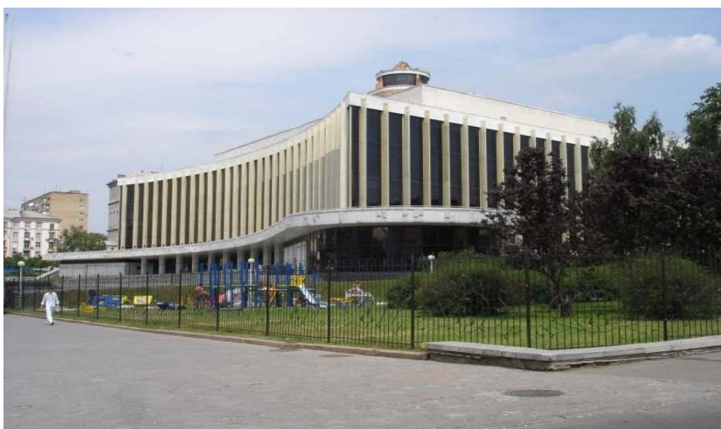
Palaco de Ukrainio