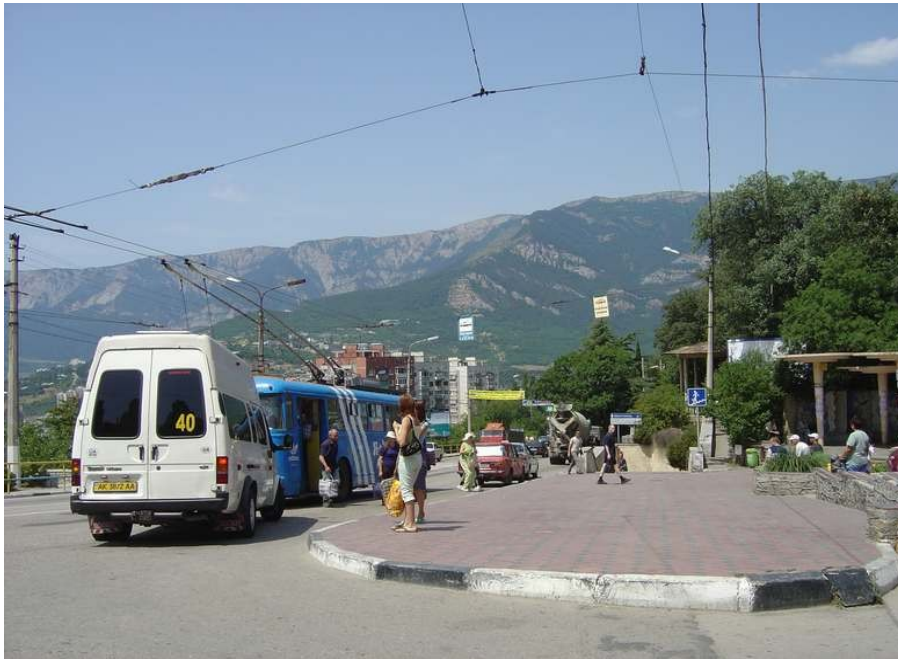
Trolebushaltejo en Massandra

Vespere ni renkotiĝas kun verŝajne la plej grava esperantisto en Jalto, Jefim. Kvankam li estas jam ne juna, li estas tre aktiva. Iomete ni konatiĝis kun Jalto, tradicia somerrestadejo de Rusoj (cetere oni parolas pli ruse ol ukraine en Krimeo). Krimeo