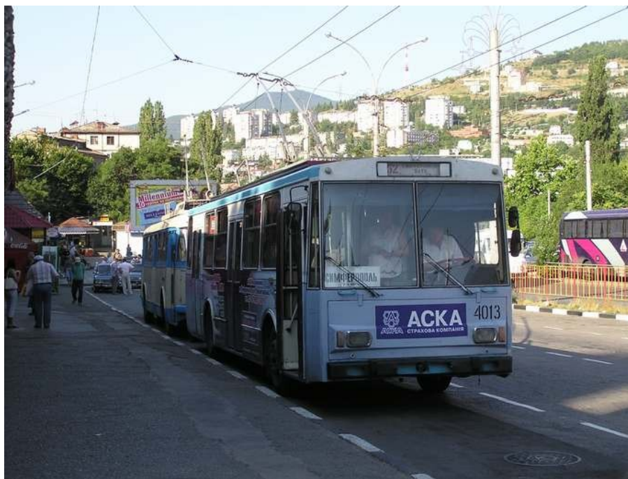
Trolebusoj en finstacio en Jalto

La renkontiĝo estis tre riĉiga, fruktodona, ĉar ni estis de lokaj homoj varme bonvenigitaj kaj ni povis trarigardi la libron "Ĉeĥoj en Krimeo", sed eĉ ĉeĥan lernejan klasĉambron, lokan muzeeton kaj tombejon, kaj tiel ni inter tiuj ĉeĥaj vortoj kaj nomoj sentis nin preskaŭ kiel en Ĉeĥio - kvankam la loĝantoj de Bohemka kaj iliaj familioj loĝas en ĉi tiu vilaĝo pli ol 140 jarojn (fakte, Bohemka estis sola vilaĝo, kie ni estis).