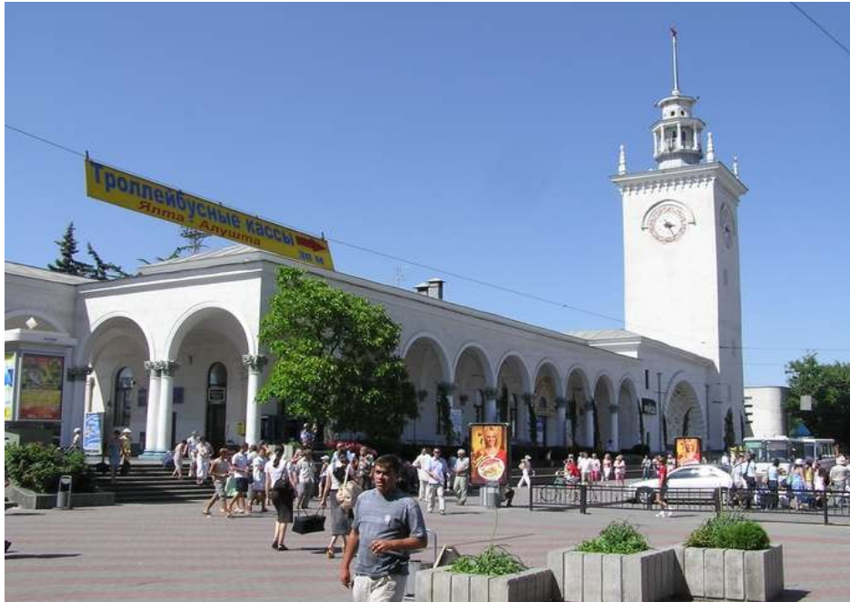
Ĉefa trajna stacio en Simferopol

vojaĝo jam estas post ni. Estas nekredeble, sed post ses monatoj ni renkontiĝis kun ŝi! Ni alvenis en la tranoktejon, kiu laŭis Ukrainion ;- ) Post tio ni startis per trolebuso en Jalton. Ni iom promenis preter la maro kaj poste ekrevenis. Kondiĉe ke oni tion povas nomi tranoktejo, ĉar ĝi estas terura konstruaĵo. Sed grava estas, ke ni povas dormi ie :)