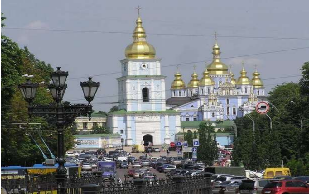
Preĝejo de sankta Sofio