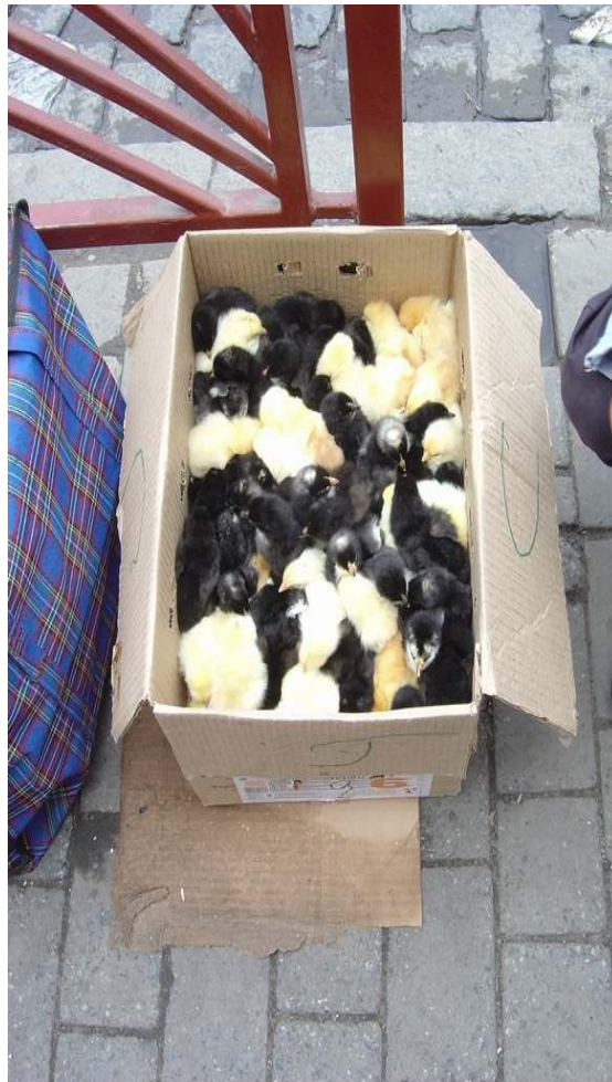
Vivantaj kokidetoj en skatolo