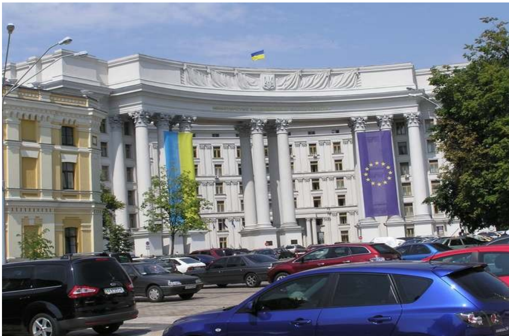
Departemento de eksterlandaj aferoj