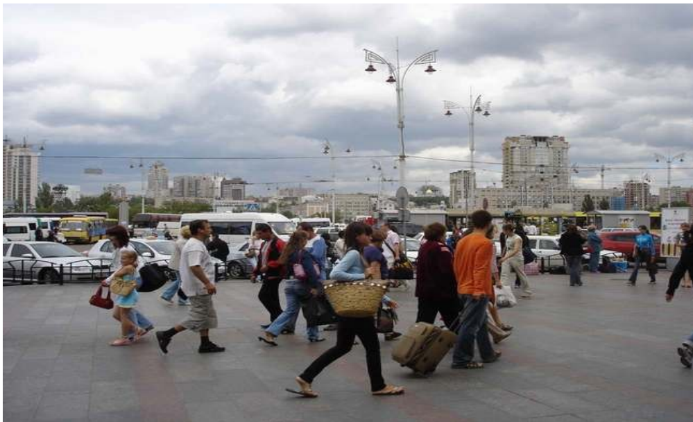
Rigardo ĉe elirejo ĉe kieva ĉefstacio