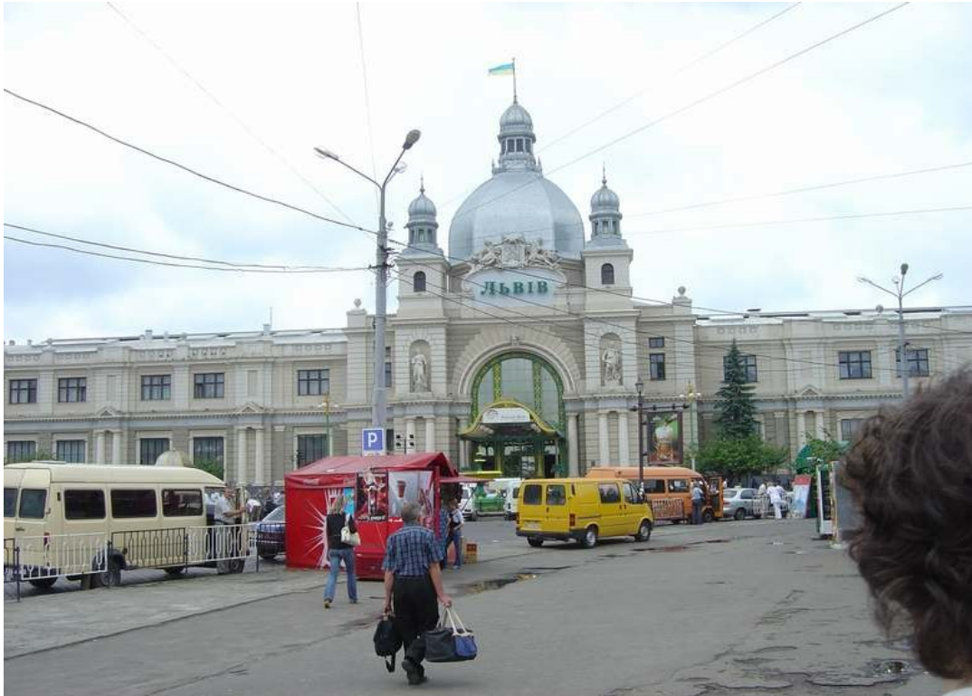
trajnstacio en Lvov