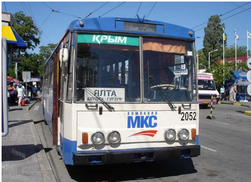
Trolebuso en finstacio en Simferopol en direkto al Jalto