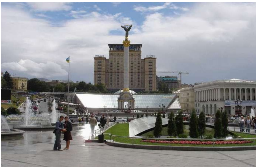
Alia rigardo al la placo de sendependeco