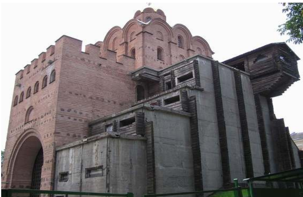
Ora pordego