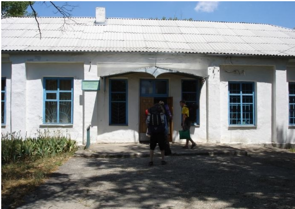
Antaŭ enirejo de la ĉeĥa centro en Bohemka