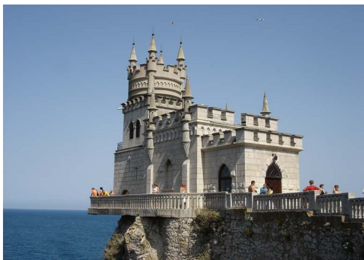
Hirunda nesto